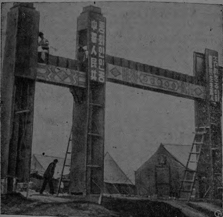
Un poco más allá de las tiendas de campaña donde las negociaciones de tregua se desarrollaron en Panmunjón, los comunistas están construyendo este arco "triumfal" bajo el cual esperan que marchen muchos de los 23,000 chinos y norcoreanos prisioneros de guerra que se han negado a regresar a sus países. Un refugio provisional donde alojar a los prisioneros de guerra que no quieren ser repatriados se ha terminado a toda prisa por la Comisión Neutral de Repatriación. Allí los representantes comunistas tendrán una oportunidad de presentar sus "explicaciones" a los anticomunistas que se niegan a ser repatriados.